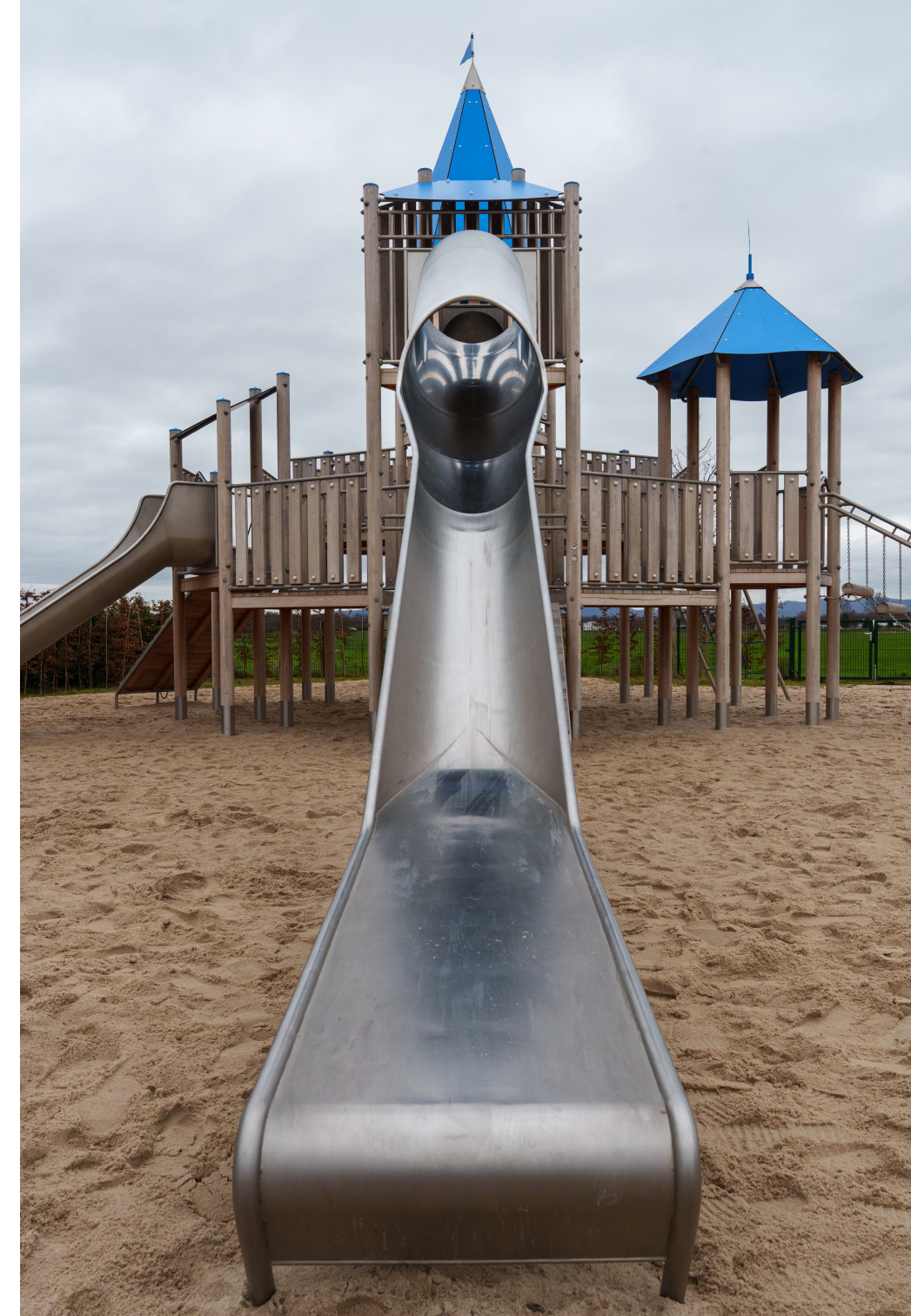
03 - Ingrid Bornhofen - Spielanlage in Gernsheim

Mein eigenes Bild zeigt also ebenfalls eine ‚Spielanlage mit diversen ‚Abfahrten‘, ‚Treppen‘ und ‚Hüttchen‘, grüne Wiese und Wald im Hintergrund und statt dem blauen Himmel über der Schanze wird bei meinem Foto das Ganze vom Blau der Dächer am Spielgerät überspannt. Perfekt, wie ich meine...Was meint ihr?